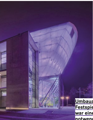
Umbauarbeiten in Gange: Beim Festspielhaus in St. Pölten war eine Generalsanierung notwendig.