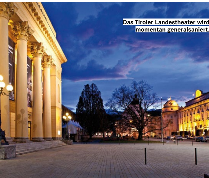
Das Tiroler Landestheater wird momentan generalsaniert.

Freie 2D-Produktbewegung mit bis zu 6 Freiheitsgraden